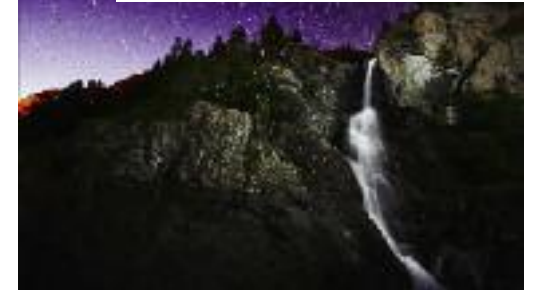
"Waterfall Lillaz" di Stefano Jeantet