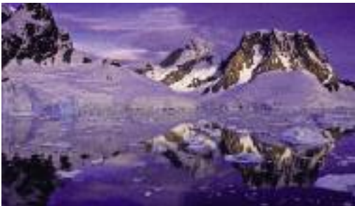
"Penisola Antartica - Riflessi nel Canale" di Alberto Nardi