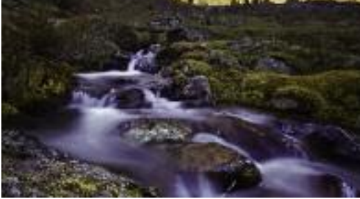
"Autunno in Valsanguigno" - Claudio Ranza